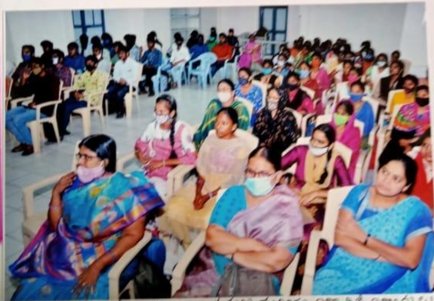
కార్యక్రమానికి పాల్గొన్న అభ్యాపకులు మరియు విద్యార్థిని బిచ్చార్లు.